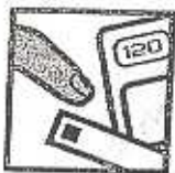
Control blood sugar Controle su azucar En la sangre