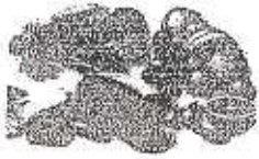
Eat healthy! Coma saludable!