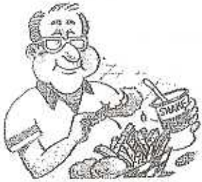
Eat burgers and fries Comer hamburguesas