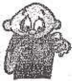
FAST HEARTBEAT PULSO ACELERADO