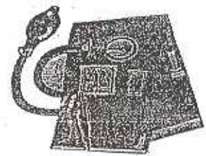
Control blood pressure Controle su presion arterial