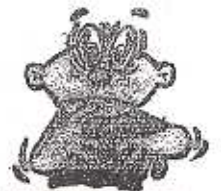
BLURRED VISION VISION BORROSA