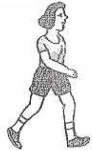
Stay Active Permanezca activo