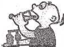
EXTREME THIRST DEMASIADA SED