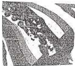
Control cholesterol Controle su colesterol